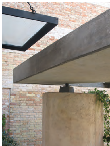
Сл.12. Италијански павиљон, атријум, Карло Скарпа Fig.12. Italian pavilion, atrium, Carlo Scarpa