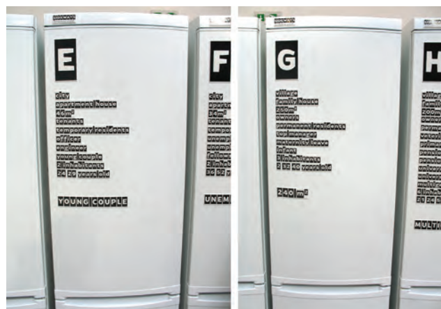
Сл.6. Однос између потреба и реалности као тема истраживања изван архитектуре Fig.6. Relation between needs and reality as a current theme beyond architecture