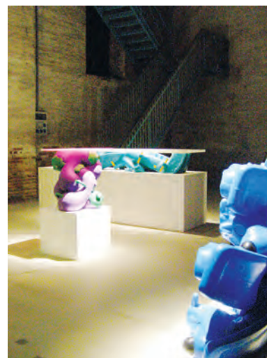
Сл.14. Намештај од рециклираних играчака, Грег Лин. Златни лав за најбољу инсталацију Fig.14. Recycled Toys Furniture, Greg Lynn. Golden Lion for Best Installation Project