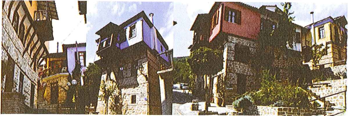
Слика 5. Карактеристична архитектура, употреба природних материјала и боје, 2017. година

На архитектуру на овом простору, како сакралну тако и профану, утиче и близина Свете Горе, што се огледа у форми и декоративним елементима, као и у тоналитетима фасада. Доказ за то је очигледан јер су мајстори који су одлазили на Атос да граде манастирске комплексе пролазили и задржавали се у Арнеји, градећи куће. Акцентована боја појединих фасада даје посебан амбијентални доживљај, пастелне нијансе небоплаве, жуте, окер, црвене и розе, што чини контраст белим фасадама и елементима од камена и дрвета.