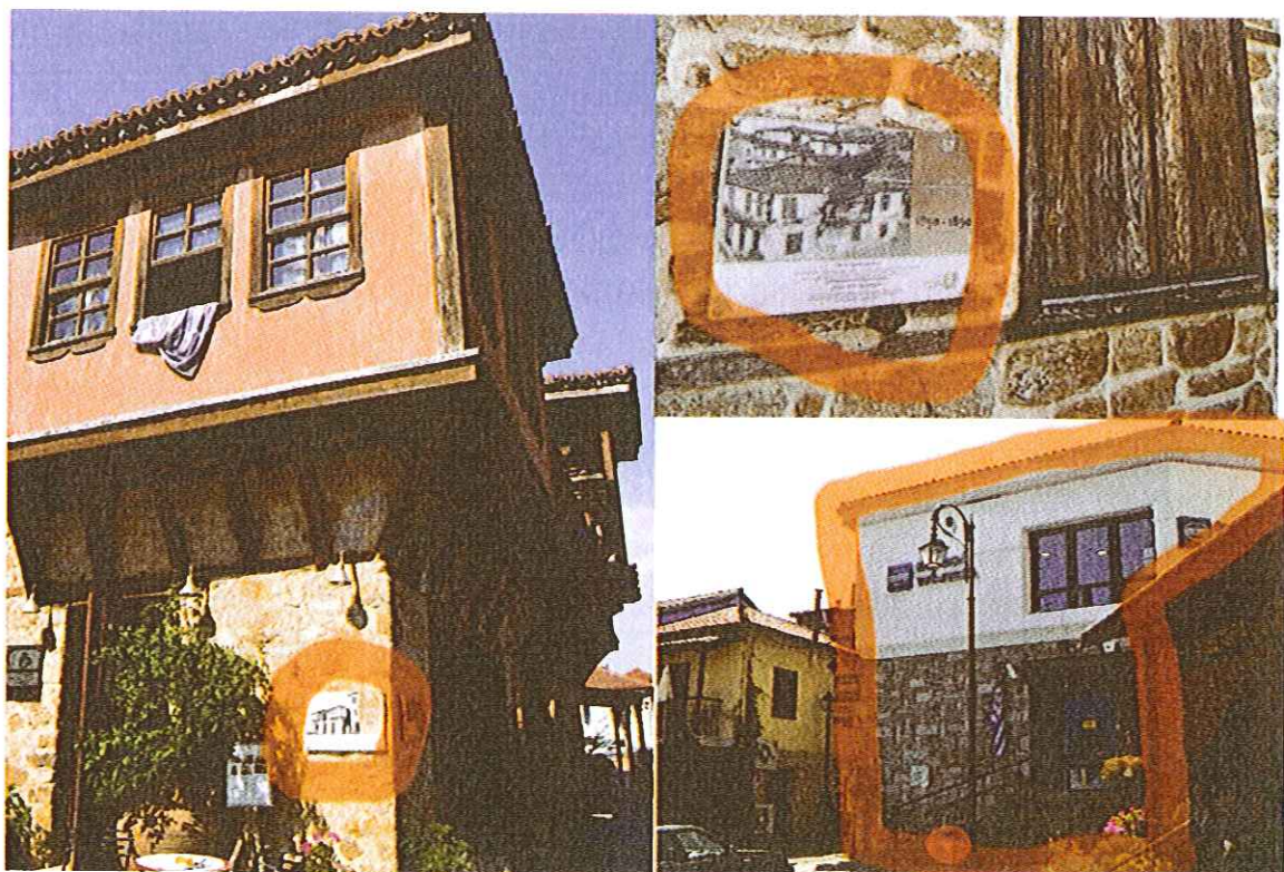
Слика 6. Истицање информативних табли на фасадама о обновљеним објектима, времену настанка и оригиналном изгледу (лево и доле десно), уклапање нових објеката у амбијент (доле десно)

На архитектуру на овом простору, како сакралну тако и профану, утиче и близина Свете Горе, што се огледа у форми и декоративним елементима, као и у тоналитетима фасада. Доказ за то је очигледан јер су мајстори који су одлазили на Атос да граде манастирске комплексе пролазили и задржавали се у Арнеји, градећи куће. Акцентована боја појединих фасада даје посебан амбијентални доживљај, пастелне нијансе небоплаве, жуте, окер, црвене и розе, што чини контраст белим фасадама и елементима од камена и дрвета.