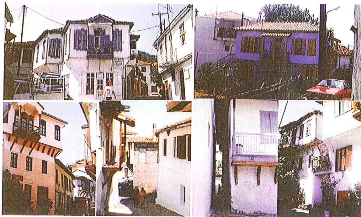
Слика 3. Почетак урбане обнове места Арнеја, период 1991–1996.

Према типологији, Арнеја припада збијеном типу насеља, што је условљено њеним географским положајем, пре свега топографијом терена и климом, која има жарка лета и зиме с могућим снежним падавинама. Из тог разлога све куће грађене су у компактном низу, на бочној граници парцеле, или с веома малим међусобним растојањима, тек толико да неко може да се провуче кроз узани пасаж између два објекта. Узане, поплочане улице места, које прате топологију терена, неретко се завршавају степеништима, што има посебан аспект у пешачком кретању. Кад се попне на више коте, на обод места, пружа се диван поглед на ћерамидом покривене кровове и репер, звоник цркве из 1889, који је иначе и симбол града. Такође се сагледава радијална матрица насеља, у којој се већина улица управних на пад терена улива у централни трг. Донекле је евидентан проблем паркирања и приступа појединим објектима због узаних улица или великог нагиба, али се то решава паркинзима који су дислоцирани у односу на центар насеља. Највећи помак, осим обнове архитектонског наслеђа, јесте пејзажно уређење јавних и полујавних простора, које је употпунило амбијент и учинило га изузетно пријатним.