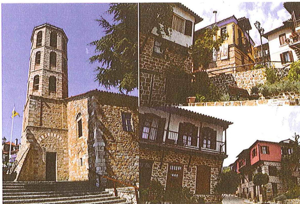
Слика 4. Реконструисани јавни простори, поплочавање и озелењавање, 2017. година

Градитељско наслеђе Арнеје дели се на веома ретке објекте старије од катастрофе 1821, затим оне настале до 1900. и објекте из периода до 1945. године. Грађевине, пре свега стамбене, приземне и на спрат, имају све одлике архитектуре Балкана, а званично се воде под називом „традиционална архитектура Македоније“. У употреби су природни материјали из околине, пре свега дрво 11 и камен. Доњи део објекта је најчешће од камена, што има двојаку функцију, с једне стране одржава температуру унутар објекта, а са друге, дом чини сигурним јер подсећа на утврђење. Поређењем објеката из различитих периода може се запазити тренд да се тремови после 1900. године претварају у балконе и тиме доприносе трансформацији насеља из руралног у урбано. Стамбени простор се састоји из просторија за дневни боравак и пријем гостију и интимних спаваћих соба, као и обавезног подрумског дела.