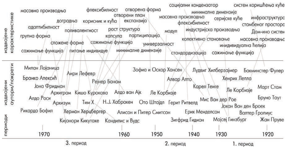
Сл. 1 Дијаграм са приказом развоја становања у току 20. века са фокусом на три периода, различите ауторе и значајне карактеристике