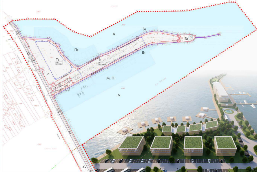
▲ Регулационо нивелациони план са елементима за спровођење

Циљ израде детаљног урбанистичког плана је реализација туристичког комплекса који се састоји од хотела са 4 звездице и луксузних апартмана, са речном марином на дунавској обали поред Сребрног језера. Планом је обухваћен део територије општине Велико Градиште, укупне површине око 17,85 ха.