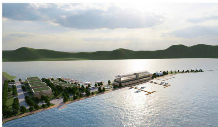
◀ Примери уређења: 1. базен, 2. марина, 3. обалуотврда, 4. сплав, 5. видиковац, 6. светионик

Планирана бициклистичка стаза у потпуности ободно опслужује простор и у функцији је промовисања мобилности, рекреације, као и јачања свести о очувању животне средине, кроз развој еколошки прикљивних видова саобраћаја, а део је трасе EuroVelo 6. На зеленој површини на самом крају шплица, могуће је поставити централни акценат у виду: фонтане, уметничког дела (скулптуре), светилника (не функционалног већ симболичног) или цркве/капеле.