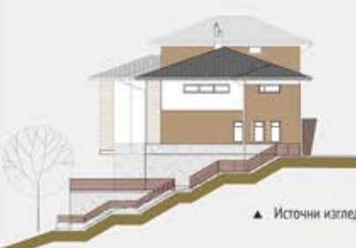
▲ Источни изглед