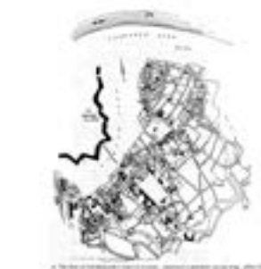
1867. Josip Jovanović, 'Објашњење плана за уређење Београда' (Explanation of the plan for the regulation of Belgrade).