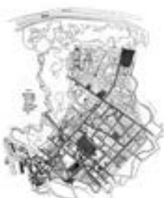
1867. Josip Jovanović, 'Објашњење плана за уређење Београда' (Explanation of the plan for the regulation of Belgrade).

The plan for the regulation of the town in a moat was a significant urban planning proposal for Belgrade. It aimed to organize the city's layout along the Sava River, creating a grid system and defining the boundaries of the town. The plan was a response to the need for a more structured and organized urban environment.