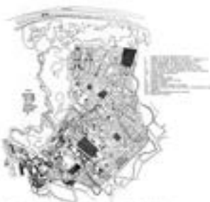
1867. Josip Jovanović, 'Објашњење плана за уређење Београда' (Explanation of the plan for the regulation of Belgrade).