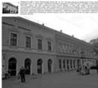
Слика: Јосимовић, Ј. 1867. Објаснење регулације београдске вароши. Београд: Ј. Јосимовић, 1867.