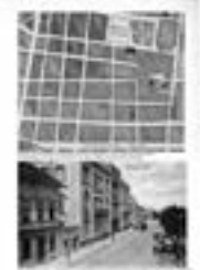
Слика: Јосимовић, Ј. 1867. Објаснење регулације београдске вароши. Београд: Ј. Јосимовић, 1867.