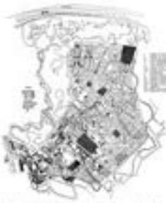
Слика: Јосимовић, Ј. 1867. Објаснење регулације београдске вароши. Београд: Ј. Јосимовић, 1867.