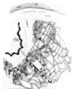
Слика: Јосимовић, Ј. 1867. Објаснење регулације београдске вароши. Београд: Ј. Јосимовић, 1867.