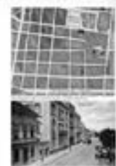
1867. Josip Jovanović, 'Објашњење плана за уређење Београда' (Explanation of the plan for the regulation of Belgrade).