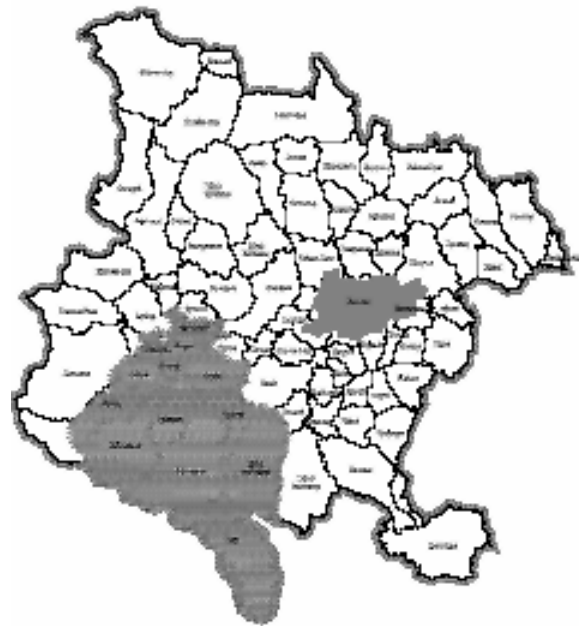
Slika 1. Deo planova u opštini Valjevo

Poučan je problem izrade SPU za planove na području opštine Valjevo, gde je doneta odluka da se pristupi izradi SPU Prostornog plana opštine, ali ostaje problem izrade SPU za Generalni plan grada, Prostorni plan posebne namene za vodnu akumulaciju Rovni i niz planova generalne i detaljne regulacije koji se rade istovremeno. Neki od ovih planova prikazani su na karti (slika 1).