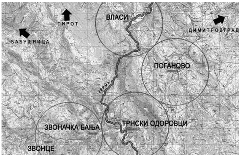
Слика 3. Географски положај сеоских насеља у кањону реке Јерме (Марић и др.).

Поред кањона реке Јерме, као најупечатљивијег природног потенцијала подручја, који је истовремено и обједињујући просторно-географски елемент посматраних села, као просторне специфичности издвајају се: Звоначка бања, Специјални резерват природе Јерма и разуђен брдски простор предеоних целина којима припадају село Поганово и Трнски Одоровци. Звоначка бања представља ресурсну основу за развој здравственог туризма, СРП Јерма погодује развоју еко-туризма (подржавање заштите природних ресурса, посматрање природе), док брдско-планинска зона отвара могућности пласирања различитих туристичких активности у природи (лов, риболов, јахање, бициклизам, планинарење, пешачење).